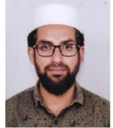
അപ്പൻ ബ്ലോക്ക് പഞ്ചായത്ത് സെക്രട്ടറി