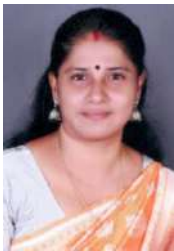
സെൻസി വൈസ് പ്രസിഡന്റ്, ധനകാര്യ സ്റ്റാന്റിംഗ് കമ്മിറ്റി ചെയർപേഴ്സൺ