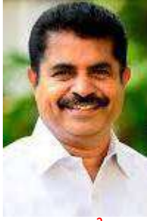
അഡ്വക്കേറ്റ് പ്രകാശ് എം.പി ആറ്റിങ്ങൽ പാർലമെന്റ് മണ്ഡലം