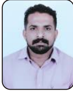
സജീവ് എം.പി കണ്ടാണശ്ശേരി ശ്രാമപഞ്ചായത്ത്