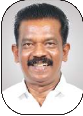
കെ. രാധാകൃഷ്ണൻ എം.പി. - ആലത്തൂർ