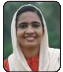
റഷിയ ഷിഹാബ് മെമ്പർ