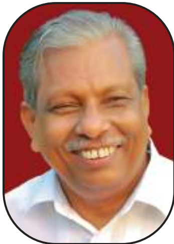
എ. സി. മൊയ്തീൻ എം.എൽ.എ - കുന്നംകുളം