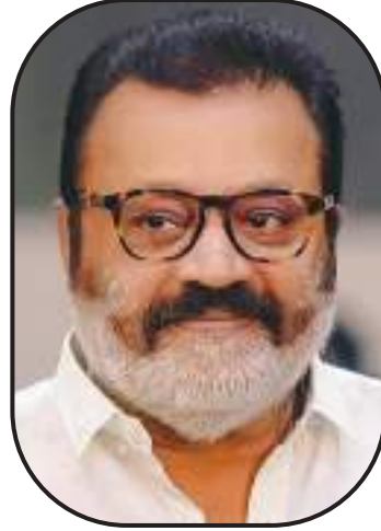
സുരേഷ്ഗോപി എം.പി. - തൃശൂർ