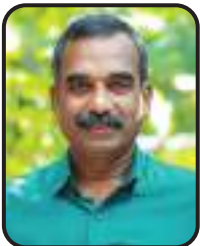
ഘോഷ് പുവ്വത്തികൽ മെമ്പർ