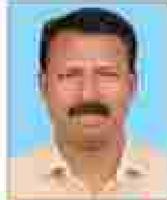
അദ്ധ്യക്ഷൻ എ. വി പ്രിയദർശി രീതികൾ - 10 (അദ്ധ്യക്ഷൻ)