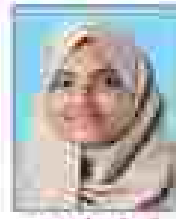
മുഹമ്മദ് റി.പി രീതികൾ - 01 (അംഗങ്ങൾ)