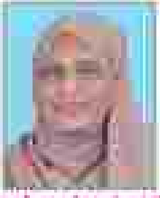
മറീഖ ഫീസാൻകുട്ടി രീതികൾ - 01 (അംഗങ്ങൾ)