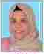
നാദി റി.പി രീതികൾ - 01 (അംഗങ്ങൾ)