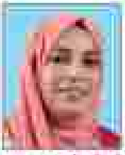
സുഹാസനി വി.പി രീതികൾ - 04 (അംഗങ്ങൾ)