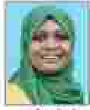
ഫാദി റിപ്പി രീതികൾ - 01 (അംഗങ്ങൾ)