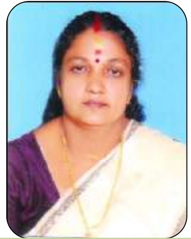
മിനി.എസ്, (വൈസ് പ്രസിഡന്റ്)