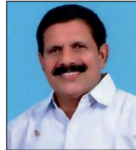
ദേവതിനാശി വകുമാർ 12-ാം വാർഡ് ചെയർ