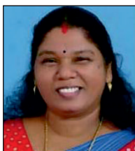
പ്രീതി. വി. 14-ാം വാർഡ് ചെയർ