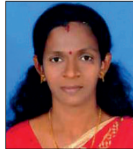
ശാരിക. ഡി. എസ്. 10-ാം വാർഡ് ചെയർ