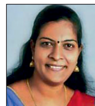
ഗീത. റ്റി. എസ്. 18-ാം വാർഡ് ചെയർ