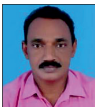
തനി. കെ. 21-ാം വാർഡ് ചെയർ