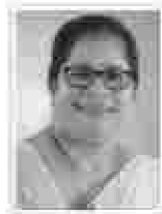
ശ്രീമതി. സാരന്ധ അക്കര മെമ്പർമാൻ മെമ്പർമാൻ ഗ്രാമീൻ കമ്മ്യൂ