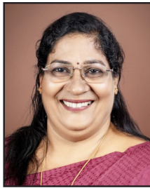
ലത ചെറിയൻ ചെയർമാൻ വികസനകാര്യ സ്റ്റാന്റിംഗ് കമ്മിറ്റി