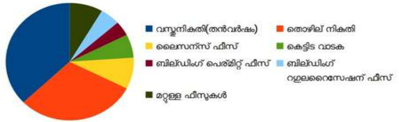
തനത് വരുമാനത്തിൽ വിവിധ നികുതി/നികുതിയേതര വരവിനങ്ങളുടെ പങ്ക്

തൻവർഷം വസ്തുനികുതി, കെട്ടിട വാടക എന്നിവയുടെ പിരിവ് താഴെയാണ്. ധനകാര്യ വകുപ്പിന്റെ 18-10-2022-ലെ സ.ഉ.(എം.എസ്.)179/ ഒരു സാമ്പത്തിക വർഷം ഡിമാന്റ് ചെയ്യുന്ന തനത് പിരിച്ചെടുക്കാതിരുന്നാൽ തുടർവർഷം ഗ്രാന്റ് തുകയിൽ ( വരുത്തുമെന്ന് നിഷ്കർഷിച്ചിട്ടുണ്ട്. നികുതി/നികുതിയേതര വരുമാന ന വികസന ഫണ്ട് നഷ്ടപ്പെടുന്ന സാഹചര്യം ഒഴിവാക്കേണ്ടതാണ്. കഴിഞ്ഞ മൂന്ന് വർഷം നികുതി/നികുതിയേതര ഇനങ്ങളിൽ ( തുകകളുടെ വിശദാംശം ചുവടെ ചേർക്കുന്നു.