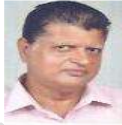
ജോസഫ് എബ്രഹാം ജനപ്രതിനിധി