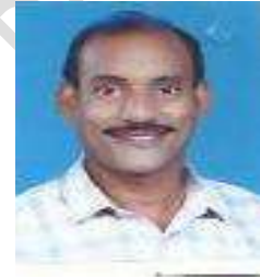
ജിറ്റു കുര്യൻ എബ്രഹാം ജനപ്രതിനിധി