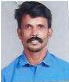
ജയകൃഷ്ണൻ കെ ജനപ്രതിനിധി