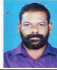
ലത്തീഫ്.എൻ ചെയർമാൻ, ക്ഷേമകാര്യം