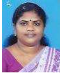
രഞ്ജിനി ചന്ദ്രൻ ജനപ്രതിനിധി