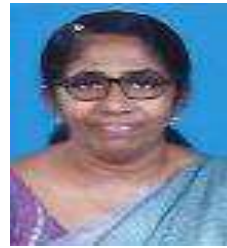
ലില്ലി വർഗ്ഗീസ് ജനപ്രതിനിധി