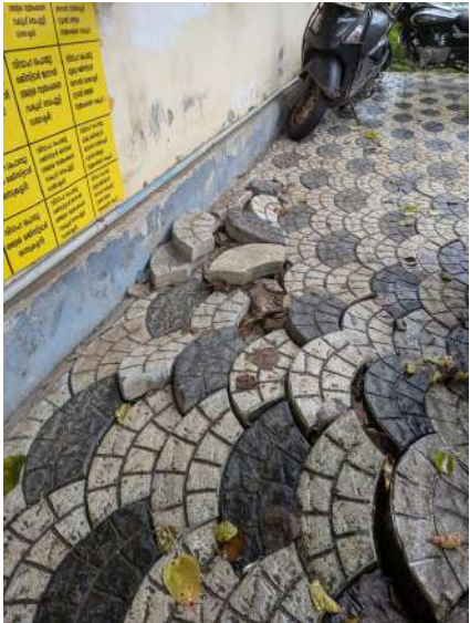
വേർ തിങ്ങി പൊട്ടിപ്പൊളിഞ്ഞ പഞ്ചായത്തിന്റെ മുൻഭാഗം

ചിങ്ങോലി ഗ്രാമപഞ്ചായത്തിൽ ഭരണസമിതി അംഗങ്ങളും, വീ ചേർന്ന് 81 ഓളം പേർ പഞ്ചായത്ത് ഓഫീസിന് ഭരണനിർവ്വഹണത്തിന്റെ ഭാഗമായും എത്തുന്നുണ്ട്. ഇതു