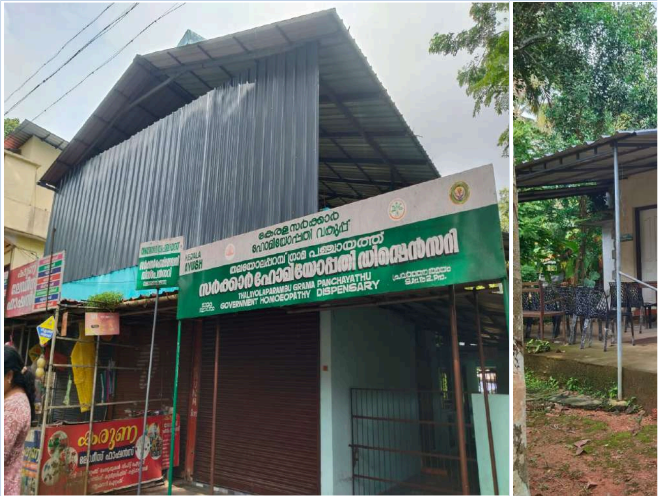
സർക്കാർ ഹോമിയോപ്പതി ഡിസ്പെൻസറി, വടയാർ ഗവ. റ

കുടുംബക്ഷേമകേന്ദ്രവും പ്രവർത്തിക്കുന്നു. ഇതിനുപുറമെ സബ്സെന്ററുകൾകൂടി പ്രവർത്തിക്കുന്നുണ്ട്. കൂടാതെ പ്രവർത്തിക്കുന്ന ഗവ.ഹോമിയോ ഡിസ്പെൻസറി ഗവ.ആയുർവേദാശുപത്രിയും ഗ്രാമപഞ്ചായത്തിന്റെ ആരോഗ്യപരിരക്ഷാസ്ഥാപനങ്ങളാണ്.