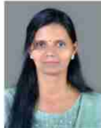
അൻപാൻ അൻപാൻ മെമ്പർ വാർഡ് - 14