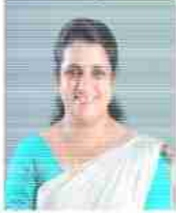
ജിന സിറിയക് പ്രസിഡന്റ്