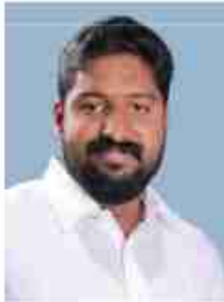
അൻപാൻ സണ്ണി മെമ്പർ വാർഡ് - 9