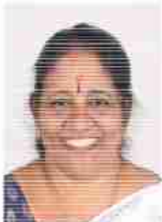
അൻപാൻ റി. പി. മെമ്പർ വാർഡ് - 12