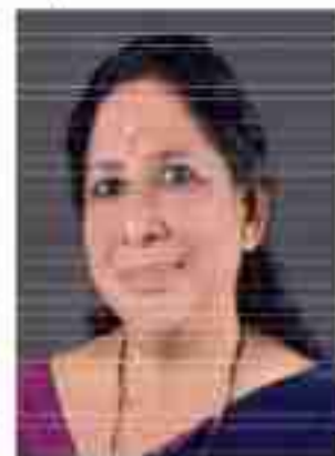
സുജാത അനിൽകുമാർ സ്റ്റാന്റിംഗ് കമ്മറ്റി ചെയർപേഴ്സൺ ആരോഗ്യവും, വിദ്യാഭ്യാസവും