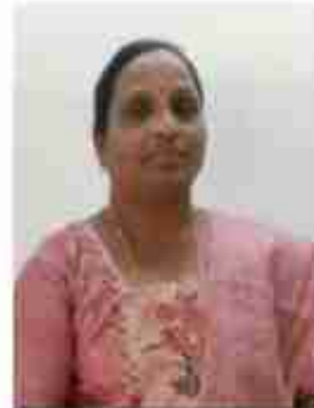
അൻപാൻ അപ്പച്ചൻ മെമ്പർ വാർഡ് - 10