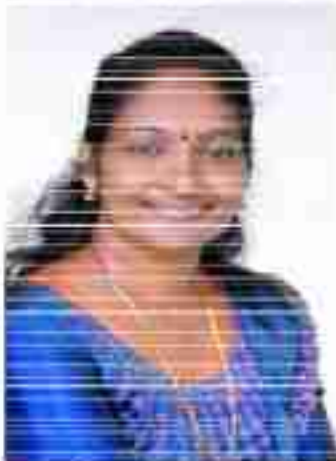
അൻപാൻ അൻപാൻ മെമ്പർ വാർഡ് - 13