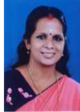
ബിനു (വാർഡ് - 3)