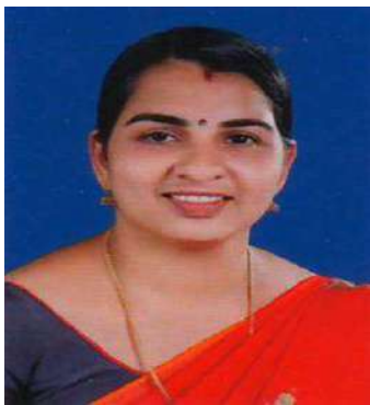
ആശാനിജു(ആരോഗ്യ - വിദ്യാഭ്യാസകാര്യസ്റ്റാന്റിംഗ് കമ്മിറ്റി ചെയർപേഴ്സൺ)