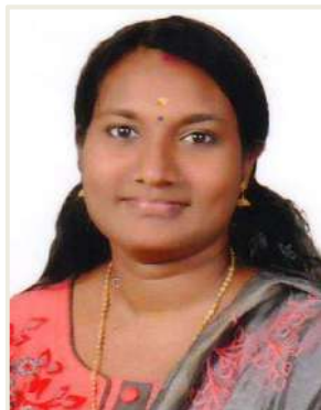
സോണിബിഷ് (വാർഡ് - 5 )