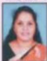
ശ്രീമതി ശ്രീമതി ശ്രീധര വയസ്സ് - 5