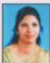
ശ്രീമതി ശ്രീമതി ശ്രീധര വയസ്സ് പ്രസിഡന്റ്, വയസ്സ് കമ്മ്യൂണിറ്റി കമ്മിറ്റി, വയസ്സ് - 1