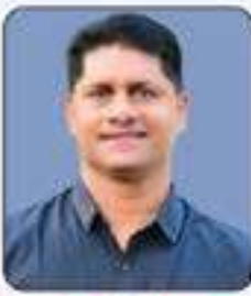
പ്രീ.സുബീൻ സമീം വാർഡ് - 7