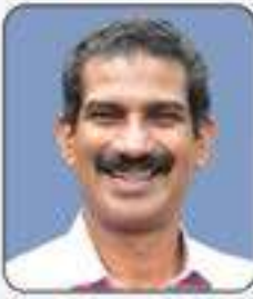
പ്രീ.അനീ.കെ.സി. വാർഡ് - 13