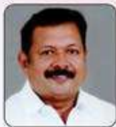
പ്രീതി.കനോൾ ജോസഫ് പെരുമ്പുഴ കേരളകാര്യ വൃന്ദവിൾ കമ്മറ്റി