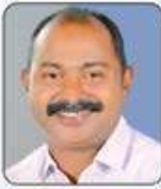
പ്രീ.ജിനു പെരിയൻ വാർഡ് - 12