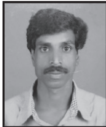
ചടയാണി ക്ഷേമകാര്യ സ്റ്റാന്റിംഗ് കമ്മിറ്റി ചെയർമാൻ