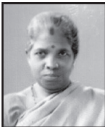
ചന്ദ്രിക 5-ാം വാർഡ് ചെയർ