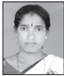
ചിന്താമണി 9-ാം വാർഡ് ചെയർ