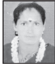
സരസ്വതി 2-ാം വാർഡ് ചെയർ