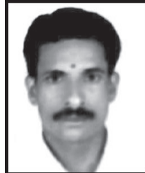
ഷൺമുഖം 13-ാം വാർഡ് ചെയർ