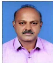
എൻദോസ് മെമ്പർ വാർഡ് 9