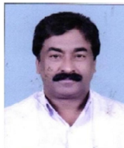
പി.പി. എൻദോസ് മെമ്പർ വാർഡ് 6