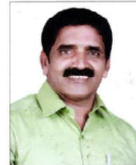
കെ.പി. സുരേഷ് ആരോഗ്യ വിദ്യാഭ്യാസ സ്റ്റാന്റിംഗ് കമ്മിറ്റി ചെയർമാൻ