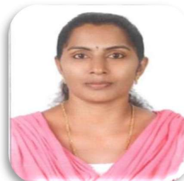
ജിഷ വാർഡ് അംഗം 3