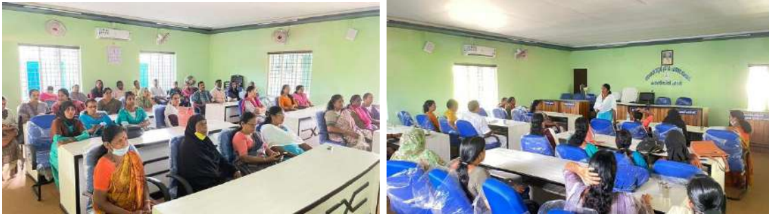
മാലിന്യ സംസ്കരണവുമായി ബന്ധപ്പെട്ട് പഞ്ചായത്ത് തലത്തിൽ കൂടിയ സർവകക്ഷി യോഗത്തിൽ നിന്ന്

03.05.2023 മാലിന്യ സംസ്കരണവുമായി സർവകക്ഷി യോഗം ഗ്രാമപഞ്ചായത്തിൽ കൂടി മാലിന്യ സംസ്കരണവുമായി പ്രശ്നങ്ങളും നിവാരണ മാർഗ്ഗങ്ങളും യോഗത്തിൽ ചർച്ച ചെയ്തു. പങ്കാളിത്തം 32.