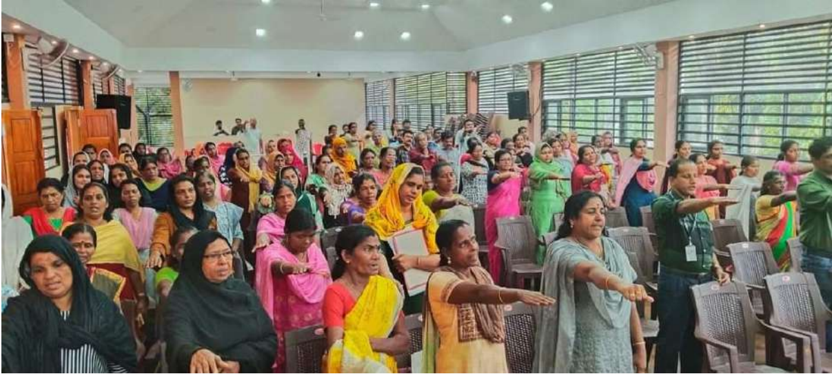
അശമന്നൂർ ഗ്രാമപഞ്ചായത്തിന്റെ ഹരിതസഭ പ്രതിജ്ഞ ചൊല്ലൽ