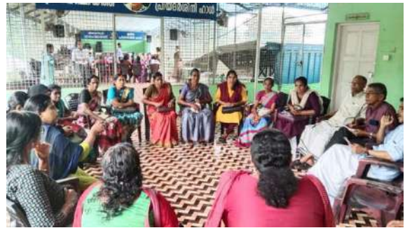
കുടുംബശ്രീ / ഹരിതകർമ്മ സേന ഫോക്കസ് ഗ്രൂപ്പ് ചർച്ച