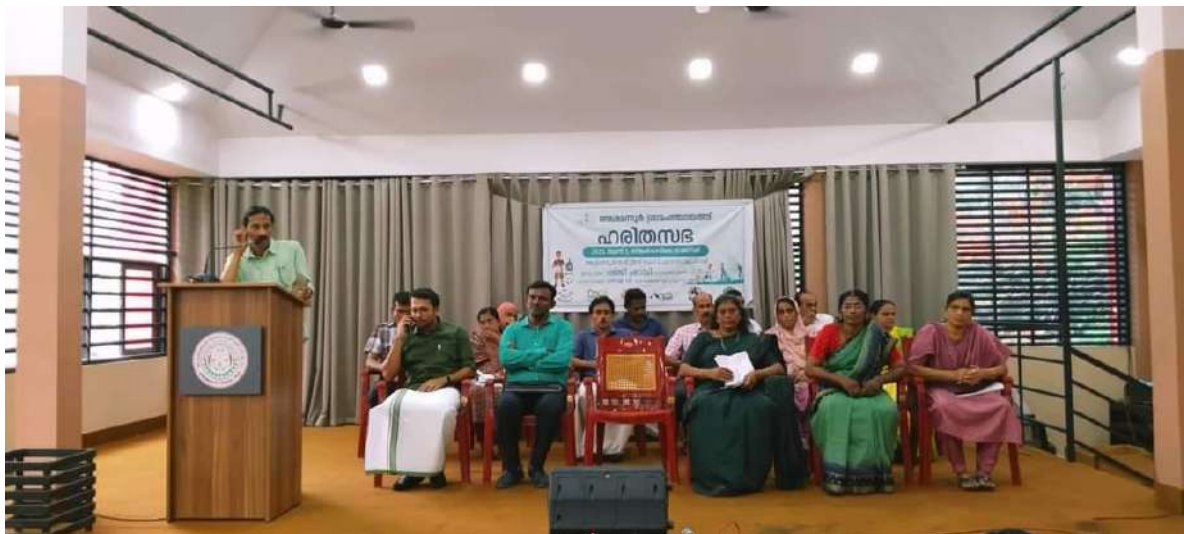
അശമന്തർ ഗ്രാമപഞ്ചായത്തിന്റെ ഹരിതസഭ ഉദ്ഘാടനം

പ്ലാനറ്റിക് ഉപയോഗത്തിന്റെ ദൃഷ്ടി വശങ്ങളെ കുറിച്ച് ചർച്ച ചെയ്തു. ഇത്തരമം ഉണ്ടാകുന്ന പരിസ്ഥിതി പ്രശ്നങ്ങൾ ചർച്ച ചെയ്തു. വികസന കാര്യ സ്റ്റാന്റിംഗ് കമ്മിറ്റി ചെയർ പേഴ്സൺ പ്രതിജ്ഞ ചൊല്ലിക്കൊടുത്തു. ഹരിതകർമ്മ സേനയുടെ പ്രവർത്തനങ്ങളെ സംബന്ധിച്ച് ആരോഗ്യ വിദ്യാഭ്യാസ സ്റ്റാന്റിംഗ് കമ്മിറ്റി ചെയർ പേഴ്സൺ വിശദീകരിച്ചു. റിപ്പോർട്ടിന്മേൽ ഗ്രൂപ്പ് ചർച്ചകൾ നടത്തി. അതിന്റെ അവതരണവും നടത്തി.