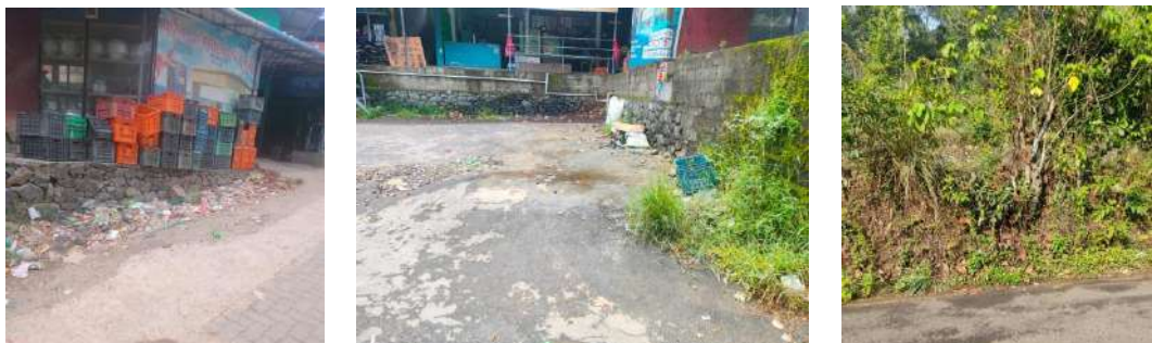
വാർഡ് 8 - കോട്ടച്ചിറ വൈറ്റ് ബ്രിഡ്ജിനോട് ചേർന്ന റോഡിൽ കൂട്ടിയിട്ടിരുന്ന മാലിന്യം നീക്കം ചെയ്യുന്നതിന് മുൻപ് (ചിത്രം 1). മാലിന്യം നീക്കം ചെയ്യുന്നതിന് ശേഷം (ചിത്രം 2, 3)

പഞ്ചായത്തിൽ 5 സ്ഥലങ്ങളിലാണ് മാലിന്യം കൂനകൾ (GVP) ഉണ്ടായിരുന്നത്. അത് നീക്കം ചെയ്തു.