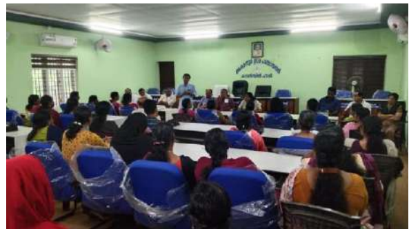
മാലിന്യമുക്ത നവകേരളം ക്യാമ്പയിന്റെ ഭാഗമായി ഗ്രാമപഞ്ചായത്തിൽ ചേർന്ന യോഗത്തിൽ നിന്ന്