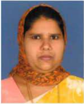
സെലീന കെ. എസ്. ഓഫീസ് അറ്റൻഡന്റ്