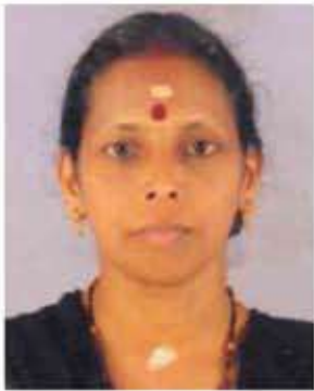
വത്സ എം. സി. പാർട്ടി ടൈം സ്വീപ്പർ