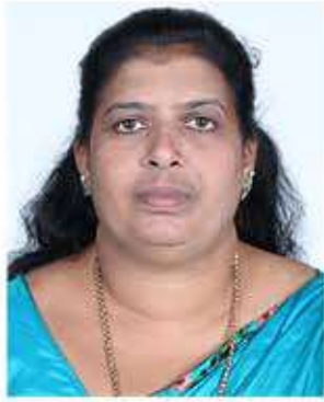
പ്രസിഡന്റ് ശ്രീമതി. ഷിജി ഷാജി