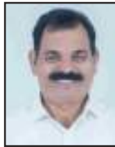
കെ.വി. എൽദോ വാർഡ് 10