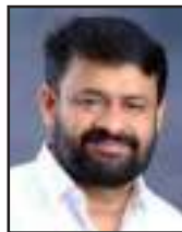
ബാവകുഞ്ഞു കെ. എ. വാർഡ് 19