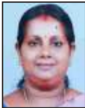
ആശ രവി വാർഡ് 13