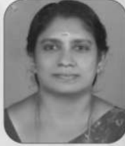
വൈസ് പ്രസിഡണ്ട് ഉഷ ശ്രീനിവാസൻ ധനകാര്യന്റിംഗ് കമ്മിറ്റി ചെയർപേഴ്സൺ