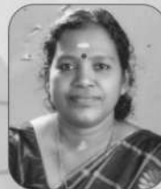
ലത എം.ആർ. മൈൻ 7-30 വാർഡ്