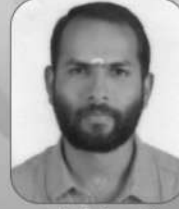
ബിജിഷ് എ.ബി. മൈൻ 12-30 വാർഡ്