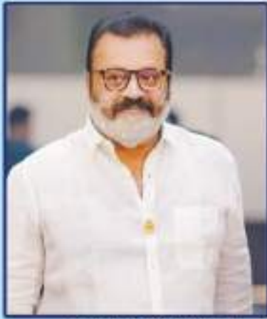
സുരേഷ് ഗോപി ബിഹു. എം.പി.