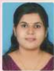
ശ്രീജ കെ. ജി. ചെയർപേഴ്സൺ ആരോഗ്യം വിദ്യാഭ്യാസം സ്റ്റാന്റിംഗ് കമ്മിറ്റി (വാർഡ് - 6)