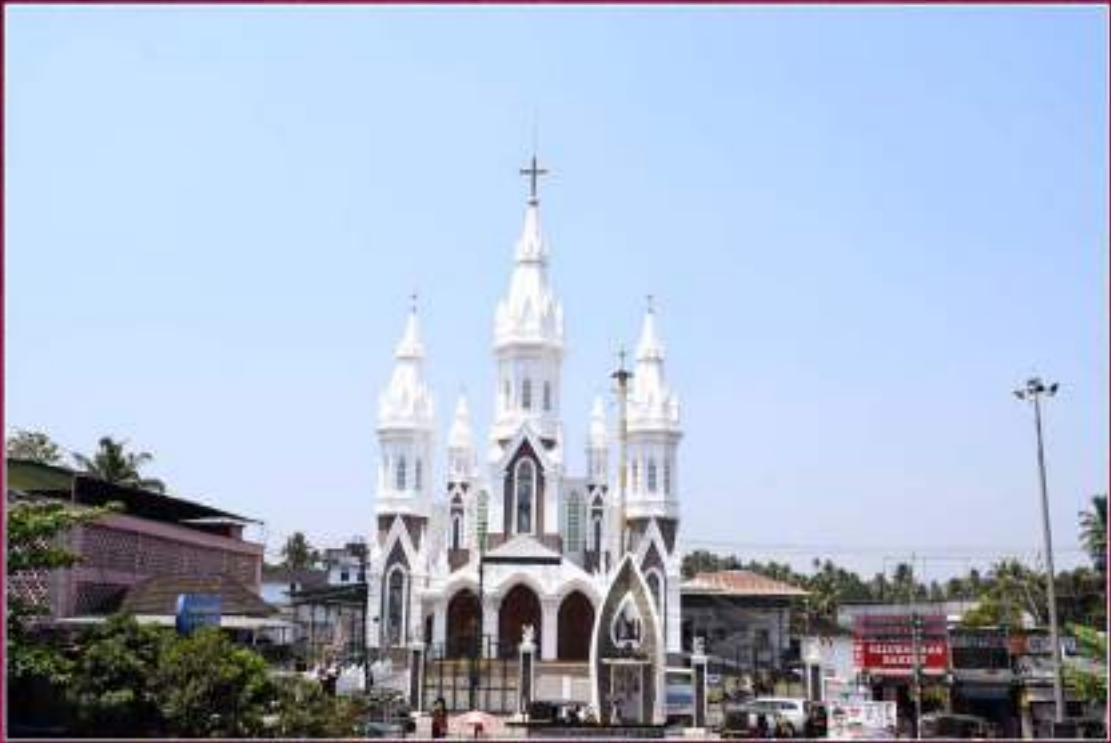
പുതുക്കാട് സെന്റ് ആന്റണീസ് ഫൊറോന പള്ളി