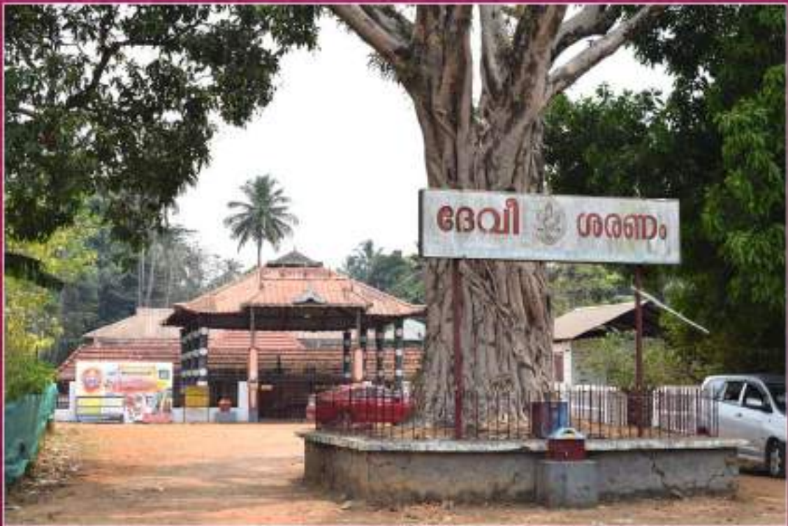
കുറുമലിക്കാവ് ഭഗവതി ക്ഷേത്രം