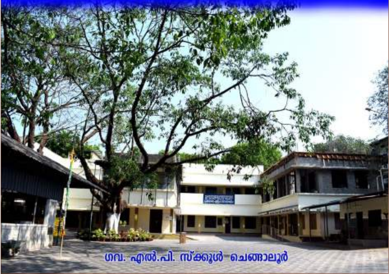
ഗവ. എൽ.പി. സ്കൂൾ ചെങ്ങാലൂർ