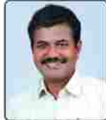
ജോൺസൺ എ. എ. ഐ. സ്റ്റാന്റിംഗ് കമ്മിറ്റി ചെയർമാൻ ക്ഷേമകാര്യം