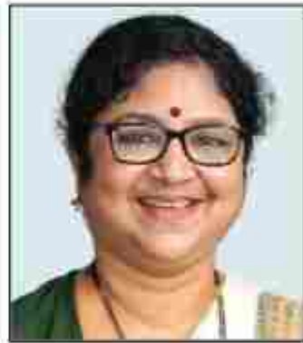
ഡോ. ആർ. ബിന്ദു ബഹു: ഉന്നത വിദ്യാഭ്യാസ സാമൂഹ്യനീതി വകുപ്പ് മന്ത്രി