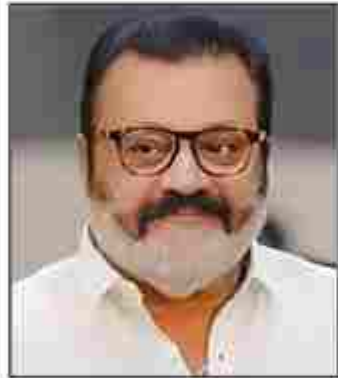
സുരേഷ് ഗോപി ബഹു: രാഷ്ട്രോല്പാദനം-പ്രകൃതിവാതക കേന്ദ്രസഹമന്ത്രി