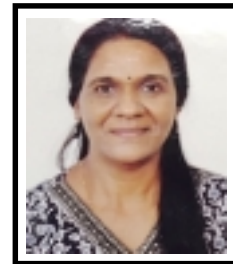
പ്രീതി. സി. യു ഓഫീസ് അസിസ്റ്റന്റ്