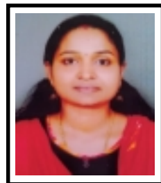
മഞ്ജു. കെ. എം അക്കൗണ്ടന്റ് കം ഐ. ടി