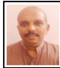
അബിൻ. യു. എസ് ഓഫീസ് അസിസ്റ്റന്റ്