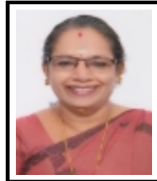
എം. കെ. ശൈലജ ക്ഷേമകാര്യ സ്റ്റാന്റിംഗ് കമ്മിറ്റി ചെയർപേഴ്സൺ