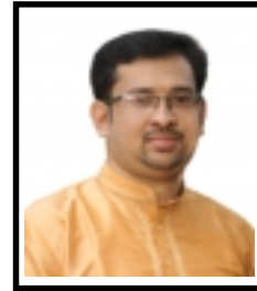
വൈശാഖ്. കെ. ഡി ടി. എ