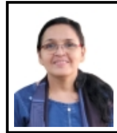
സമിത. ജി സെക്രട്ടറി