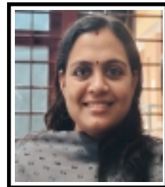
ഷിൽപ്പ. വി. എസ് സീനിയർ ക്ലർക്ക്