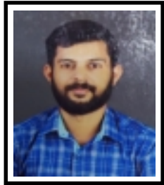
അനീൽ. വി. ജി അക്കൗണ്ടന്റ്