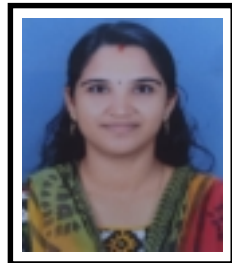
ഷാര. വി. എസ് ക്ലർക്ക്