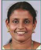
ശ്രീമതി ആനി ആന്റു വാർഡ് 2