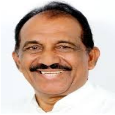
ബെന്നി ബഹന്നാൻ ബഹു. ചാലക്കുടി എം.പി.