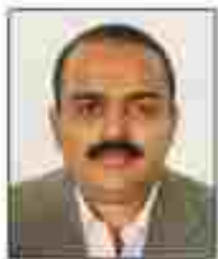
ജി.പി.എസ്. കെ.പി. ജി.കെ.എസ്. സുരേഷ് കെ.ടി.പി.എസ്.പ്രബീരൻ