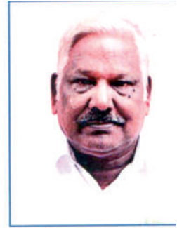
മുത്തു ചെയർമാൻ ക്ഷേമകാര്യ സ്റ്റാന്റിംഗ് കമ്മിറ്റി