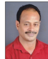
ചെന്താമര ചെയർമാൻ, വാർഡ് - 7 ( ക്ഷേമകാര്യ സറ്റാൻഡിംഗ് കമ്മിറ്റി )