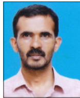
ജൈരമൻ. ആർ മെമ്പർ, വാർഡ് - 9