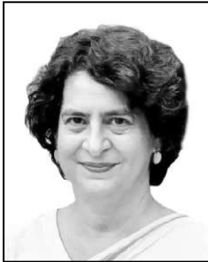
പ്രിയക ഗാന്ധി (MP)