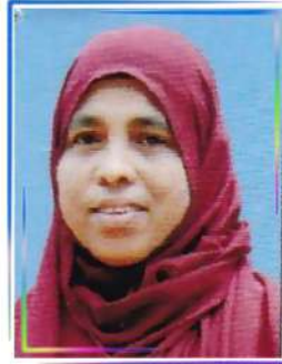
സുലൈഖ വാർഡ് 5