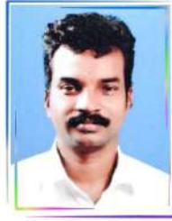
ശിബികുമാർ. കെ. സി വാർഡ് 9