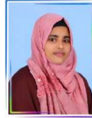
റഘു. എ. കെ വാർഡ് 13