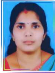
രജില. സി വാർഡ് 12