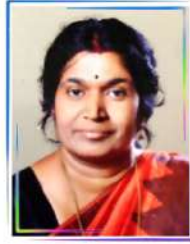
ഗീത. സി വാർഡ് 2