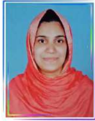
ജയ്തിദ. പി വാർഡ് 1