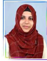
സക്കീന വാർഡ് 10