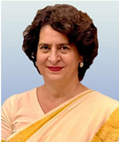
പ്രിയങ്കു ഗാന്ധി വാദ്ര എം.പി. - വയനാട് മണ്ഡലം