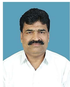
ബീരാൻകുട്ടി മണ്ണിൽ തൊടി