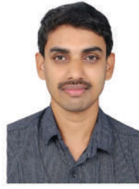
ഷൗക്കതൈലി ഇ മെമ്പർ (വാർഡ് 14)