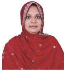
മാരിയത്തുൽ കിബ്തീയ്യ മെമ്പർ (വാർഡ് 12)