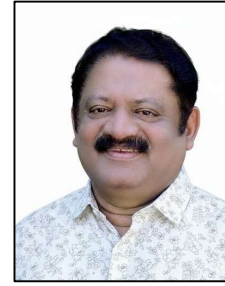
അബ്ദുൽ നാസർ എൻ ടി പ്രസിഡന്റ്