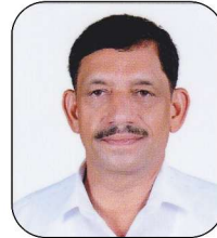
ഹിംസ ടി.വി (ആരോഗ്യ - വിദ്യാഭ്യാസ സ്റ്റാന്റിംഗ് കമ്മിറ്റി ചെയർമാൻ)