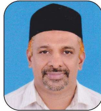
സയീദ് അബ്ദുള്ള മൻസൂർ തങ്ങൾ (പ്രസിഡണ്ട്)