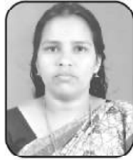
ഷീജ (ബിന്ദു) ചെയർപേഴ്സൺ, ക്ഷേമകാര്യ സ്റ്റാന്റിംഗ് കമ്മിറ്റി