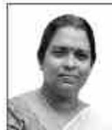
അനന്ത വി.പി. മെമ്പർ, വാർഡ് 6 കോൺക്രീറ്റ്