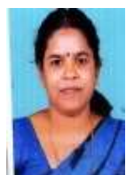
ഗിരിജ കളരിക്കുറുത്തൂർ മെമ്പർ വാർഡ് - 19