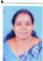
എം പി പ്രസീത വികസന കാര്യ സ്റ്റാ. കമ്മിറ്റി ചെയർപേഴ്സൺ