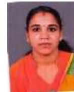
രമ്യ കണ്ടിയിൽ മെമ്പർ വാർഡ് - 5