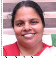
ടി പി മിനിക പ്രസിഡണ്ട് ഗ്രാമപഞ്ചായത്ത്