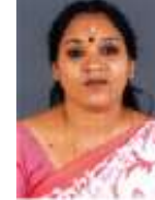
സീമ തൊണ്ടായി മെമ്പർ വാർഡ് - 4