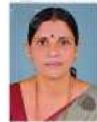
ആരോഗ്യം - വിദ്യാഭ്യാസം സ്റ്റാന്റിംഗ് കമ്മിറ്റി