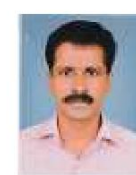
വിസകന സ്റ്റാന്റിംഗ് കമ്മിറ്റി