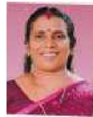
ധനകാര്യ സ്റ്റാന്റിംഗ് കമ്മിറ്റി