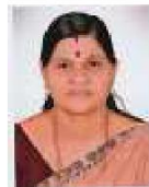
ക്ഷേമകാര്യ സ്റ്റാന്റിംഗ് കമ്മിറ്റി