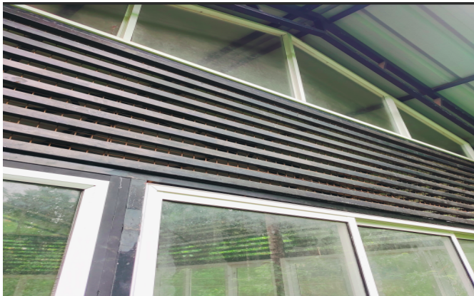
കീഴൽ ലക്ഷം വീട് കോളനി സാംസ്കാരിക നിലയം

വാളൂർ GUPS നവീകരണം (135/24), എം.സി.എഫ് നവീകരണം (157/24), പകൽവീടുകളുടെ സംരക്ഷണം- അറ്റകുറ്റപ്പണി (165/24), കോളനികളിലെ സാംസ്കാരിക നിലയം പുനരുദ്ധാരണം (163/24) എന്നീ പ്രവൃത്തികളിലും കൃത്യമായ ആസൂത്രണം ഇല്ലാത്തത് മൂലം സമാനമായ അപാകത ഉണ്ടായിട്ടുണ്ടെന്നത് അധിക ചെലവിന്റെ വ്യാപ്തി വ്യക്തമാക്കുന്നതാണ്.