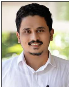
ജുനൈസ് പി.കെ. മെമ്പർ