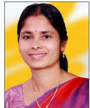
ശ്കുന്തള കുനിയിൽ മെമ്പർ