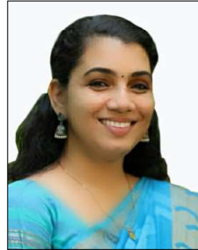
ശാന്തി മാവീട്ടിൽ മെമ്പർ