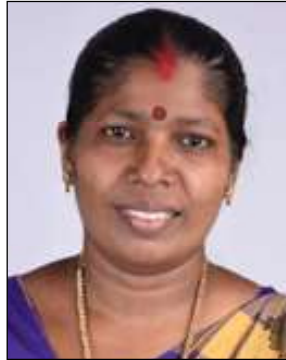
രമ പി.എം മെമ്പർ