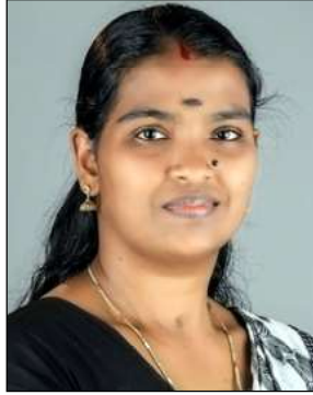
രേഖ വെള്ളത്തോട്ടത്തിൽ മെമ്പർ