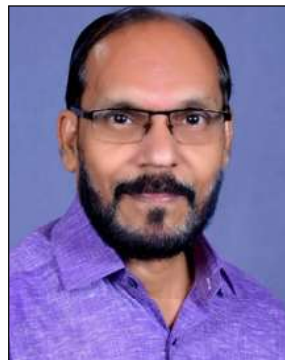
വാസവൻ പൊയിലിൽ മെമ്പർ