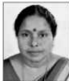
പുനത്തിൽ ജ്യാതിക ആരോഗ്യ വിദ്യാലയം സ്റ്റാൻഡിംഗ് കമ്മിറ്റി ചെയർപേഴ്സൺ