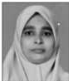
അഴത്തയിൽ അമലൈയത്ത് വീകസന സ്റ്റാൻഡിംഗ് കമ്മിറ്റി ചെയർപേഴ്സൺ