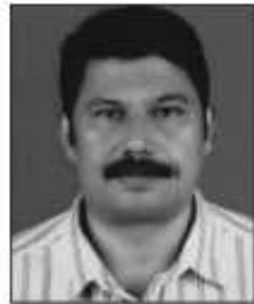
സി.ജാനറ്. ആർ സെക്രട്ടറി