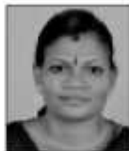
ശ്രീലത കണ്ടിയിൽ ജനർൽ, വാർഡ് 7