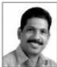
അമ്മേഴ് തമ്പുരാകുണ്ടിയിൽ ജനർൽ, വാർഡ് 3