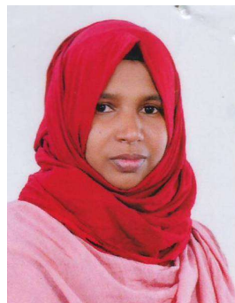
ബുഷ്റ അഷ്റഫ് വാർഡ് - 19