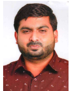
എം ടി വികസന സ്റ്റാൻറിങ്ങ് സ്റ്റാൻറിങ്ങ് കമ്മിറ്റി ചെയർമാൻ