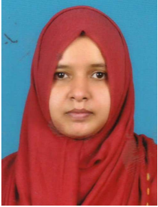
സൗദാബീവി വാർഡ് -1