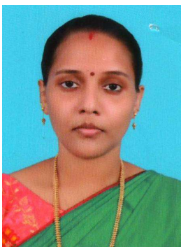
ആർഷ്യ ബി എം വാർഡ് - 17