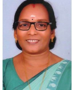
വള്ളി വി എം വാർഡ് -4