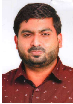
എം ടി അയ്യൂബ്ഖാൻ വാർഡ് - 14