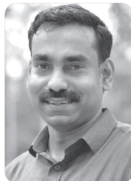
എം.ടി റിയാസ് വാർഡ് 13