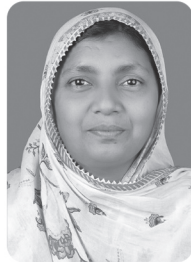
ഷംലുലത്ത് വാർഡ് 02