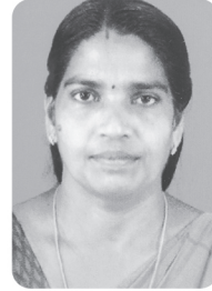
കോമളം തോണിച്ചാലിൽ വാർഡ് 04