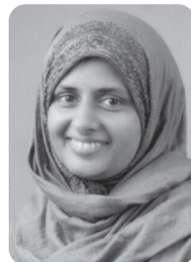
കെ.ജി സീനത്ത് വാർഡ് 14