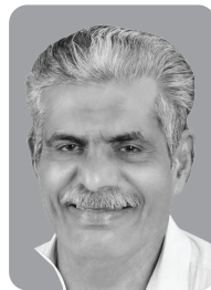
യുപി മമ്മദ് വാർഡ് 03