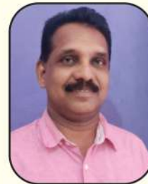
വിവദാസൻ കരോട്ടിൽ മെമ്പർ, വാർഡ് - 07