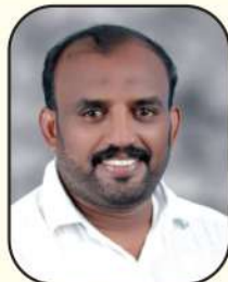
അഷ്ഫ് തച്ചാനത്ത് മെമ്പർ, വാർഡ് - 04