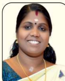
നന്ദിത വി.പി. മെമ്പർ, വാർഡ് - 17