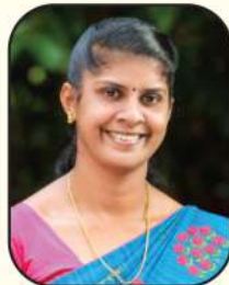
സിജി സിബി മെമ്പർ, വാർഡ് - 05