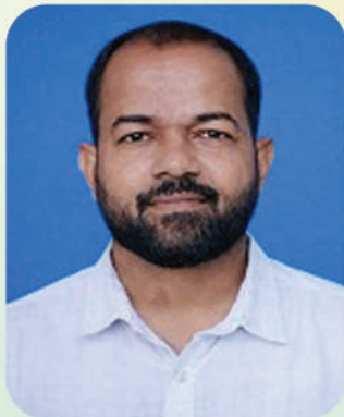
ഷിനോ കല്ലികൽ ആരോഗ്യ വിദ്യാഭ്യാസ സ്ഥിരം സമിതി അദ്ധ്യക്ഷൻ