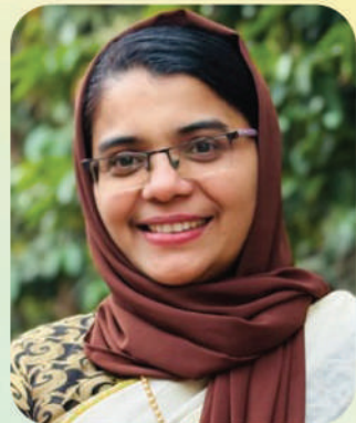
ഷെബീറ മൊയ്തു ക്ഷേമകാര്യ സ്ഥിരം സമിതി അദ്ധ്യക്ഷ