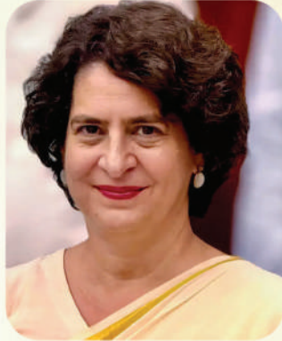
പ്രിയങ്കു ഗാന്ധി വധേര എം.പി, വയനാട്