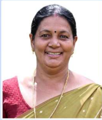
ഗിരിജ സുധാകരൻ പ്രസിഡണ്ട്