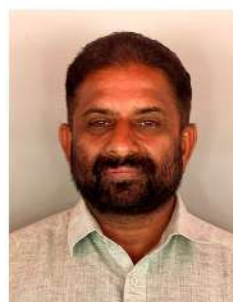
വത്സൻ എം.പി മെമ്പർ വാർഡ് 17