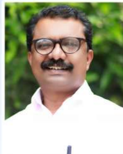
വിനോദ് തോട്ടത്തിൽ ചെയർമാൻ ക്ഷേമകാര്യം